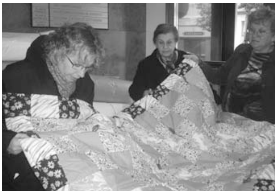
El resultado de esta labor es siempre hermoso.

No sólo aumenta el amor hacia mujeres que ni siquiera conocemos, sino que, con cada puntada, el amor entre las mismas hermanas que se embarcan en este proyecto de servicio crece. Se crean lazos de hermandad, y todas nos sentimos más cerca del Salvador al seguir su admonición de socorrer a los que sufren y llevar un mensaje de amor a los que no saben dónde hallarlo. ■