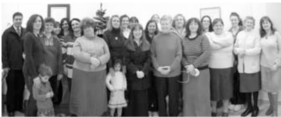
Las hermanas de la Sociedad de Socorro de Azuqueca aprenden en una Reunión de Superación a meditar y a escudriñar las Escrituras más eficazmente.

es reunirse con nuestras hermanas y compartir momentos espirituales,