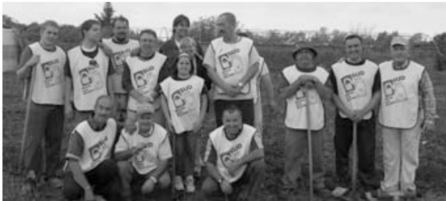
Un grupo de trece hermanos prestaron servicio durante unas cuatro horas en unos terrenos propiedad de AFANAS.

Al finalizar nos ofrecieron, como muestra de su agradecimiento, un refrigerio, durante el cual tuvimos la oportunidad de hermanarnos y conversar más ampliamente acerca del Evangelio de Jesucristo. ■